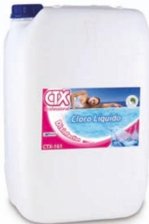
CTX-161 Cloro líquido Hipoclorito de sódio líquido 25 l (08495) O hipoclorito de sódio não requer dissolução e actua imediatamente.