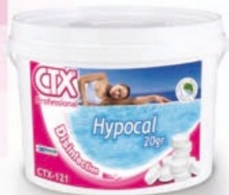
CTX-120 e CTX-121 Hypocal Hipoclorito de cálcio com 65-70% de cloro útil granulado ou pastilhas de 20 g Todo o poder desinfectante do cloro e a baixo preço

É económico e é um desinfectante usado com êxito há muitos anos no tratamento de águas.