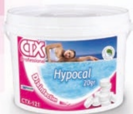
CTX-120 e CTX-121 Hypocal Hipoclorito de cálcio com 65-70% de cloro útil granulado ou pastilhas de 20 g Todo o poder desinfectante do cloro e a baixo preço

É económico e é um desinfectante usado com êxito há muitos anos no tratamento de águas.