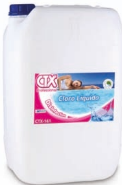
CTX-161 Cloro líquido Hipoclorito de sódio líquido 25 l (08495) O hipoclorito de sódio não requer dissolução e actua imediatamente.